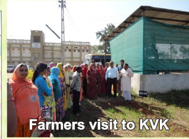
Farmers visit to KVK