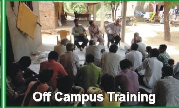
Off Campus Training