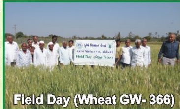
Field Day (Wheat GW- 366)

KVK has been Organized 7 field days. In these field days 300 farmers and 26 farm women participated. Field day was organized related to different FLDs on brinjal, okra, wheat, oat, serrated sickle etc. and result obtained from given technologies was higher than local variety or technology.