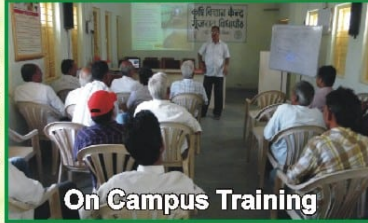
On Campus Training

Overall 61 training programmes including training for farmers, farm women, rural youth and extension personals has been organised and 1808 trainees has been participated in the training.